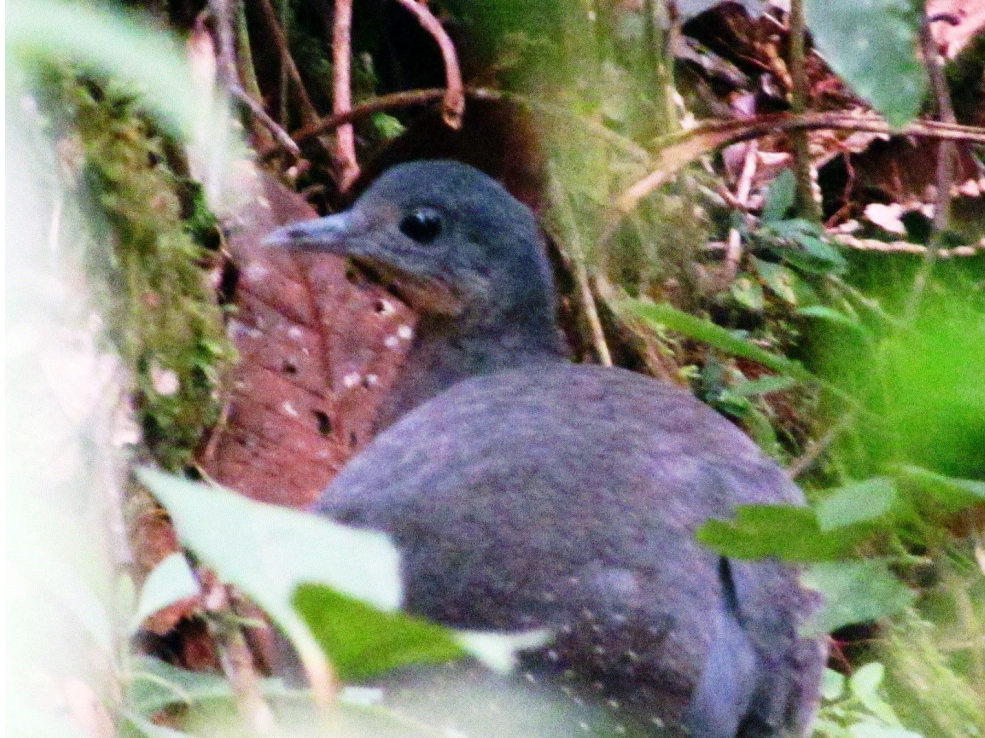
Figura 1: Adulto de Tinamú Serrano Nothocercus bonapartei fotografiado el 8 de noviembre del 2012 en el sector Colibrí - cordillera del Cóndor, sureste de Ecuador.

Estos dos registros de Nothocercus bonapartei en la cordillera del Cóndor amplían el rango de distribución de la especie en Ecuador a una zona en la cual previamente se desconocía su presencia (Figura 2). La localidad conocida más cercana corresponde a la cordillera de Numbala, a 2000 m en los Andes del sur del Ecuador (donde se colectó un individuo depositado en el Museo Ecuatoriano de Ciencias Naturales, MECN Or. 7231). El reporte en la cordillera de Kutukú (Robbins et al. , 1987), el único fuera de los Andes, se ubica a aproximadamente 130 km al norte de las localidades aquí reportadas.