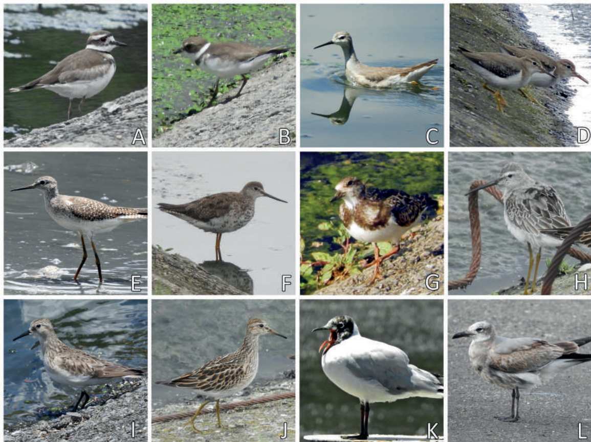
Figura 3: Aves acuáticas registradas en los humedales artificiales ubicados en la ciudad de Cuenca y sus alrededores, provincia de Azuay, Ecuador. (A) Chorlo Tildío Charadrius vociferus (Paul Molina); (B) Chorlo Semipalmeado Charadrius semipalmatus (Paul Molina); (C) Falaropo Tricolor Phalaropus tricolor (Paul Molina); (D) Anadarríos Coleador Actitis macularius (Paul Molina); (E) Patiamarillo Menor Tringa flavipes (Paul Molina); (F) Patiamarillo Mayor Tringa melanoleuca (Paul Molina); (G) Vuelvepiedras Rojizo Arenaria interpres (Paul Molina); (H) Playero Tarsilargo Calidris himantopus (Paul Molina); (I) Playero de Baird Calidris bairdii (Paul Molina); (J) Playero Pectoral Calidris melanotos (Paul Molina); (K) Gaviota Andina Chroicocephalus serranus (Paul Molina); (L) Gaviota Reidora Leucophaeus atricilla (Paul Molina).

Un individuo fue fotografiado el 1 de octubre de 2020 por PM en la PTAR-U (Fig. 3A). El individuo forrajeaba y se desplazaba de un sitio a otro en las lagunas facultativas. La especie es un visitante boreal vagabundo poco común en las tierras bajas occidentales de Ecuador, pero con escasos registros en los Andes (Freile & Restall, 2018). También es residente en el Pacífico centro-sur y en humedales interandinos del norte del país (Freile & Restall, 2018).