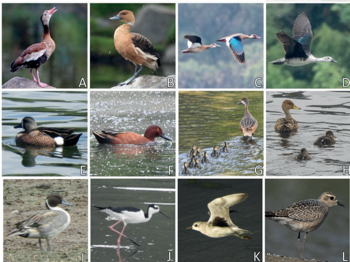
Figura 2: Aves acuáticas registradas en los humedales artificiales ubicados en la ciudad de Cuenca y sus alrededores, provincia de Azuay, Ecuador. (A) Pato Silbador Ventrinegro Dendrocygna autumnalis (Paul Molina); (B) Pato Silbador Canelo Dendrocygna bicolor (Paul Molina); (C) Cerceta Brasileña Amazonetta brasiliensis (Paul Molina); (D) Pato Crestudo Sarkidiornis sylvicola (Paul Molina); (E) Cerceta Aliazul Spatula discors (Paul Molina); (F) Cerceta Canela Spatula cyanoptera (Agustín Carrasco); (G) Ánade Cariblanco Anas bahamensis (Paul Molina); (H) Ánade Piquiamarillo Anas georgica (Paul Molina); (I) Ánade Norteño Anas acuta (Agustín Carrasco); (J) Cigüeñuela Cuellinegra Himantopus mexicanus (Paul Molina); (K) Chorlo Gris Pluvialis squatarola (Paul Molina); (L) Chorlo Dorado Americano Pluvialis dominica (Paul Molina).

Reportamos en total 38 especies de aves acuáticas agrupadas en 9 familias y 5 órdenes. En la PTAR-U registramos 37 especies, en la laguna de Tarquí 8 y en el parque El Paraíso 7 especies. Encontramos 19 especies residentes, 18 migratorias boreales y una migratoria austral. Además, registramos una especie catalogada como En peligro y tres Casi Amenazadas a nivel nacional, así como una especie Vulnerable y dos Casi Amenazadas a nivel global (Tabla 1). A continuación, presentamos comentarios sobre 16 registros notables. Adicionalmente, presentamos fotografías de 30 especies, incluyendo las 16 especies comentadas, como evidencia documental de los registros obtenidos (Fig. 2–4).