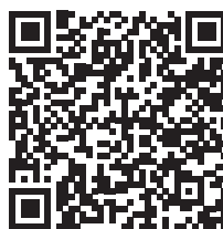
Canto de Sani