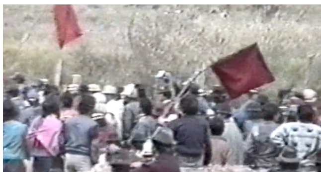
Figura 5. Fotograma de «Chapter One: Emancipation» de Derechos no humanos , Paulo Tavares, 2012.

El origen inmediato de la actual Constitución ecuatoriana se remonta a una demanda del movimiento indígena en 1990. Es en ese momento cuando el movimiento indígena irrumpió en la política nacional y abre una nueva era, proclamando: «Estamos presentes en la vida de este país... hasta ahora hemos sido permanentemente marginados, tratados como objetos dentro de la esfera política nacional, pero somos sujetos y exigimos un nuevo pacto nacional, una Constitución que reformule estas cuestiones». La actual Constitución tiene su origen en esa demanda.