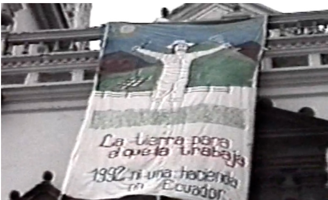
Figura 6. Fotograma de «Chapter 02: Land Rights» de Derechos no humanos , Paulo Tavares, 2012.

Esta concepción nos ha llevado a entender que la comunidad es de todos y para todos. La experiencia de nuestras comunidades dice, por ejemplo, que los medios de producción no pueden ser propiedad de una sola persona. La introducción de la idea de sumak kawsay en la Constitución proviene de esta «matriz comunitaria».