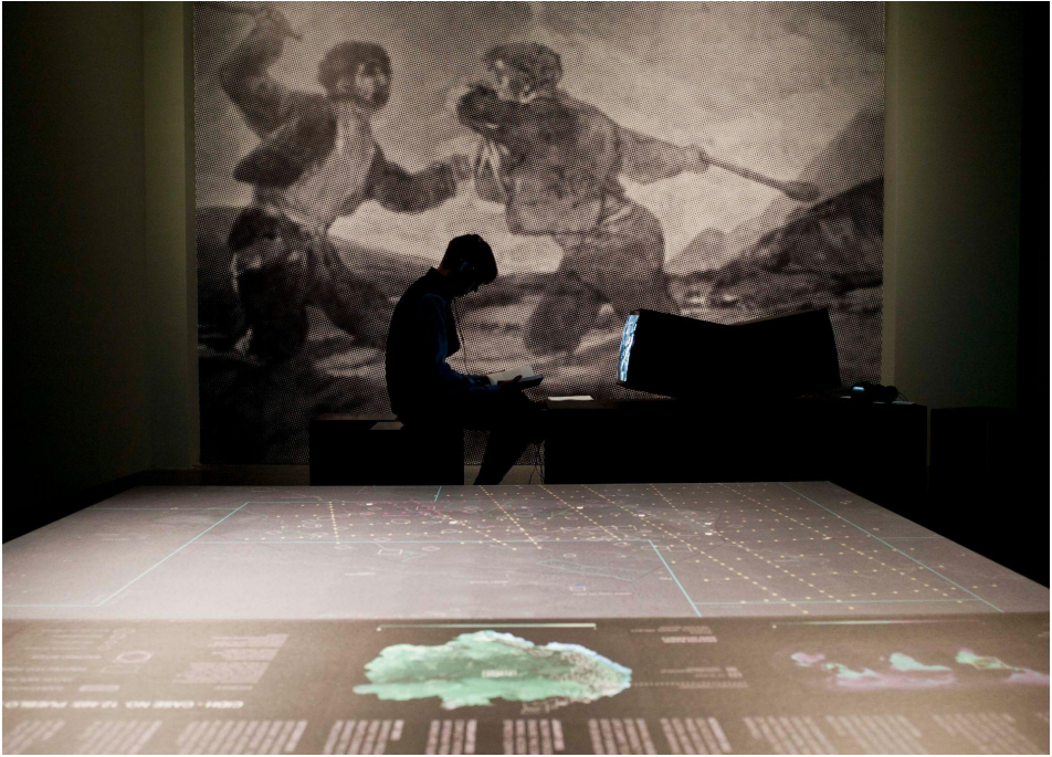
Figuras 3 y 4. Instalación de video Non-Human Rights , 2012.