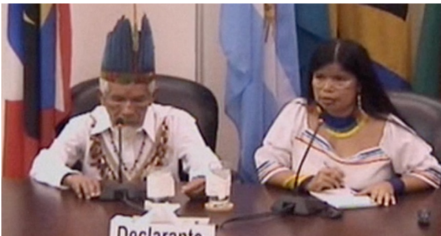
Imagen 8. Fotograma de “Chapter 04: The Natural Contract” de Derechos no humanos , Paulo Tavares 2012.

Tuvimos varias inspiraciones para la formulación de una propuesta para el reconocimiento de los Derechos de la Naturaleza. Desde un punto de vista jurídico, quizás una de las más interesantes fue un caso famoso que ocurrió en los EE. UU. en la década de 1970, conocido como «SIERRA CLUB v. MORTON». La compañía Disney había propuesto desarrollar un parque de aventuras en una zona que es particularmente importante desde el punto de vista natural, especialmente debido a la presencia de las secuoyas, esos enormes árboles que representan y simbolizan la identidad californiana y que son muy importantes desde una perspectiva biológica. La ONG estadounidense Sierra Club emprendió acciones legales para impedir la realización del proyecto. Al final, la Corte Suprema de EE. UU. falló en contra de Sierra Club, argumentando que sin reclamaciones patrimoniales sobre el bosque, no podían impedir el desarrollo. Como Sierra Club no era propietario del bosque ni de ninguno de los árboles, no podían presentar la reclamación jurídica ya que no sufrirían perjuicio. Pero uno de los jueces, William O. Douglas, hizo una intervención significativa al cuestionar por qué los propios árboles no podían reclamar justicia de acuerdo con sus propios intereses y sus propios derechos.