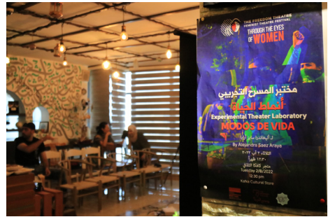
Figuras 2 y 3: Registro fotográfico capturado por la organización del Festival Trough the eyes of women , en Café Kafka. Agosto, 2022.

En ese entonces, la muestra estaba principalmente construida sobre mapas, testimonios y registros sonoros y audiovisuales que se activaban en escena. El territorio aparecía como un eje transversal de la muestra, a partir de las reflexiones que se compartían en torno a la experiencia de identificación que viví durante la estancia. Esta cuestión, que tanto en términos prácticos como dramáticos permitía reconocer dos nociones de territorio: la que yo encarnaba, proviniendo de un territorio estatal, reconocido por la Organización de las Naciones Unidas, que me permitía circular por el mundo con un pasaporte chileno; en contraposición a la de mis contertulios, que viven en un territorio ocupado, sin siquiera poder movilizarse al interior de su país, reconocido como Estado no miembro, en noviembre de 2012 por la ONU (Asamblea General de las Naciones Unidas, 2012), pero no por Israel.