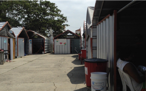
Figura 6. Albergue comunitario Montúfar, 2016.