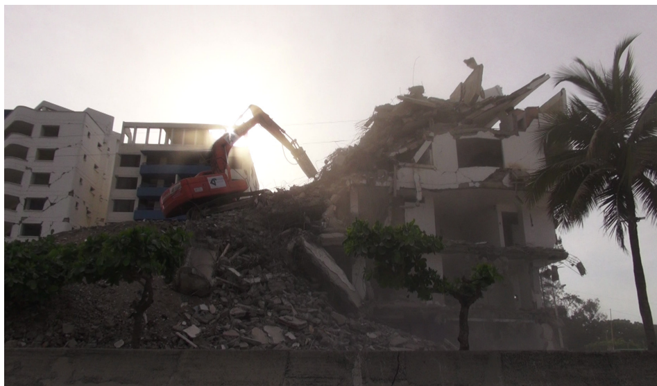
Figura 13. Demoliciones en la ciudad, 2016.

A pesar de los esfuerzos de las familias y la comunidad, los niveles escolar y societal no lograron cumplir plenamente su función de apoyo en el caso de San Roque. El retraso en el inicio del año escolar y las condiciones precarias de las aulas temporales limitaron el acceso de niños y niñas a un entorno estructurado de aprendizaje y socialización. Estas deficiencias evidenciaron la necesidad de desarrollar una infraestructura educativa más resiliente, capaz de garantizar la continuidad del aprendizaje incluso en contextos de desastre.