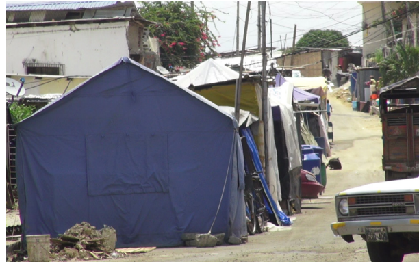
Figura 7. Albergue comunitario P. F. Cevallos, 2016.

involucran a todas las personas, desde abuela y abuelo hasta niños y niñas, quienes también asumen roles activos. Las infancias contribuyen organizando actividades recreativas, ofreciendo apoyo emocional a sus pares y participando en tareas comunitarias que refuerzan el sentido de colaboración y pertenencia. Estas dinámicas promueven una fuerte interdependencia entre los integrantes, e impulsan la resistencia colectiva frente a la adversidad.