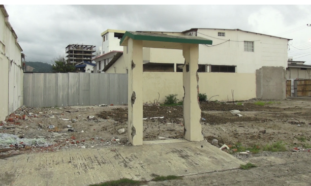
Figura 1. Restos de edificio, 2016.

Con el propósito de comprender cómo se relacionan el factor social y el factor natural en la construcción de un desastre, el investigador colombiano Wilches-Chaux (1993) propuso la fórmula: Riesgo \times Vulnerabilidad = Desastre . Por una parte, el riesgo, entendido como la posibilidad de que ocurra determinado evento geofísico en un lugar específico, es un factor biofísico ante el que se puede hacer muy poco para desescalar su intensidad (Cardona, 1993; Macías, 1992). Por otro lado, la vulnerabilidad, factor netamente social, incide en la forma en que una población es capaz de desarrollar redes de contención, apoyo y solidaridad. Tras el impacto de un terremoto, la crisis que se desata «es la actualización del grado de riesgo existente en la sociedad, producido por una inadecuada relación entre el ser humano y el medio físico natural y construido que lo rodea» (Lavell, 1996, p. 14). La vulnerabilidad no solo define la capacidad de respuesta ante un desastre, sino que también refleja las fallas profundas en la relación entre las personas y sus entornos. Lo que la perspectiva «fiscalista» no ayuda a dimensionar es que las víctimas