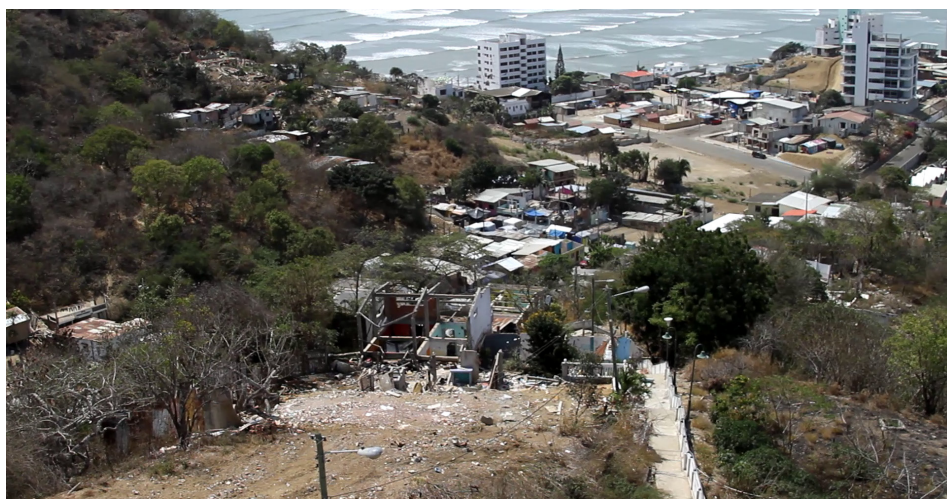
Figura 8. Vista panorámica del barrio San Roque con casas derrumbadas y albergue al fondo, 2016.

En Bahía de Caráquez, puerto estratégico fundado en 1628, las desigualdades históricas se manifestaban con fuerza en barrios como San Roque, donde históricamente las familias migrantes del campo se asentaron en terrenos precarios ubicados en lomas, sin acceso a servicios básicos. A pesar de los intentos de recuperación de la ciudad tras desastres previos, como los terremotos de 1896, 1942 y 1998, y el fenómeno de El Niño en 1997-98, la marginación de San Roque persistió, con viviendas precarias y altos niveles de pobreza. Cuando el terremoto del 16 de abril de 2016, conocido como 16A, golpeó la ciudad, esta vulnerabilidad se exacerbó, y muchas familias, incluidas las infancias, se vieron obligadas a vivir en condiciones extremas, como en una plaza pública, durante un largo periodo.