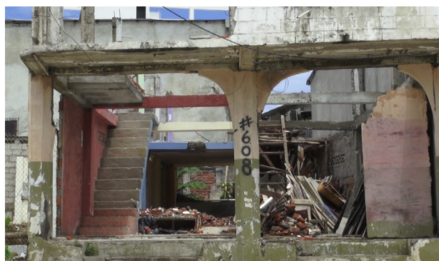
Figura 2. Casa destruida en San Roquel, 2016.