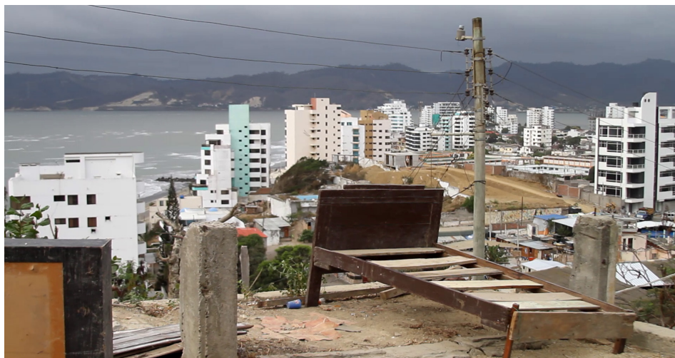
Figura 3. Restos de una casa en una loma de San Roque, 2016.

Para el desarrollo de resiliencia en niños y niñas resulta esencial el papel que ocupan diferentes niveles de estructuras sociales involucradas en su bienestar. En esta línea, Ann Masten (2020) destaca cuatro sistemas en particular que, idealmente, deben coaccionar y complementarse para brindar atención integral. En primer lugar, la familia es el núcleo principal de apoyo al ser el sistema más cercano e íntimo, desempeñando un rol crítico al proporcionar estabilidad y cuidado (Félix et al. , 2012). Por otro lado, las escuelas pueden ofrecer un entorno seguro, así como rutinas y continuidad en la educación. El tercer nivel corresponde a la comunidad, que fomenta redes de solidaridad y recursos compartidos, y el cuarto es la sociedad en general, cuya capacidad para implementar políticas efectivas y brindar apoyo estructural es crucial. Fortalecer estos cuatro niveles de cuidado resulta esencial para que niños y niñas puedan enfrentar sus propios procesos de recuperación. En consecuencia, esta investigación presta especial atención a dichos ámbitos de cuidado, tratando de comprender cómo cada uno de ellos pudo impactar en las infancias del albergue San Roque en Bahía de Caráquez.