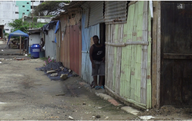
Figura 4. Albergue comunitario San Roque, 2016.