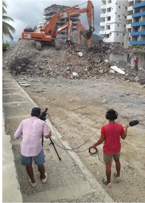
Figuras 10, 11 y 12. Rodaje en Bahía de Caráquez, 2016.