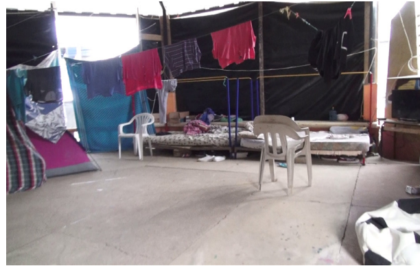
Figura 5. Interior de carpa en San Roque, 2016.