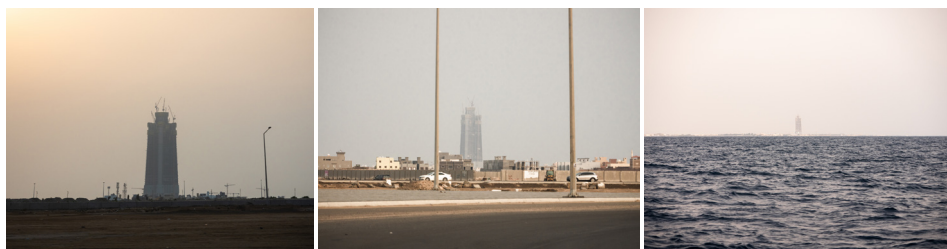
Figura 6. Torre Yeda, edificación incompleta en el nuevo Distrito Económico del Reino Saudí, frente al Mar Rojo.

Según la argumentación aristotélica —que es la que dará origen a las instituciones occidentales—, los grupos humanos se organizarían naturalmente en oikos , casas cuya acumulación resultaría en aldeas ( kóme ), y consiguientemente en la polis . La Política 18 es, desde esta perspectiva, la realización de una naturaleza teleológica de lo humano, la forma de organización comunal por excelencia, y el proceso único mediante el cual los vivos son capaces de dirimir los conflictos comunes e impartir justicia según sus propios intereses —que es una forma de llamar a la repartición de los bienes tangibles e intangibles, y por tanto, de la tierra.