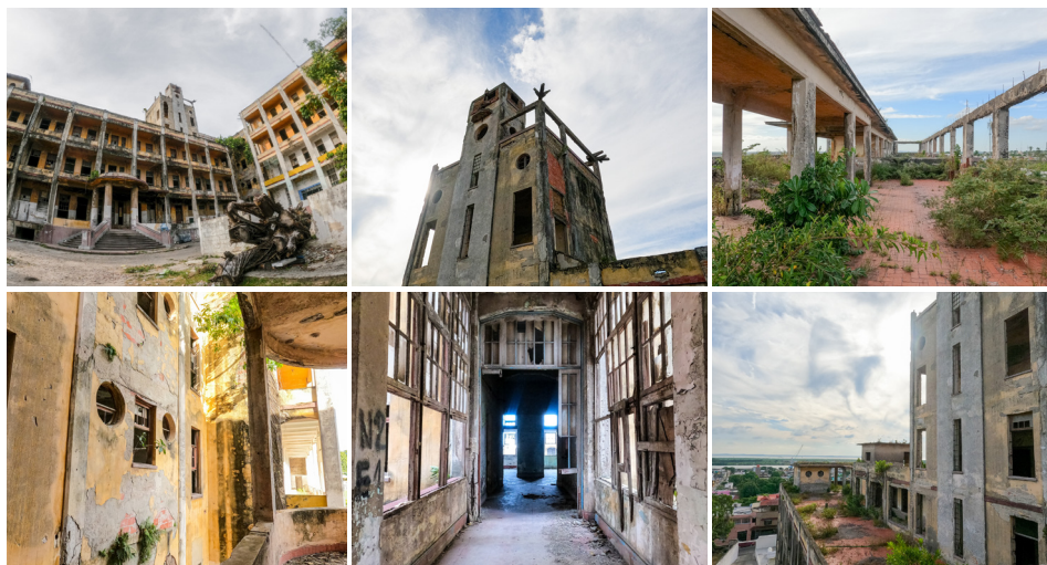
Figura 8. Ruinas del Hospital Civil en Tampico, Tamaulipas (México). ©Fernando Martín Velazco, 2021.

La promesa de la tierra futura ha nacido del principio de aniquilación de las ánimas arcaicas —los Baatsik, los Djinn, los Diyin diyé—, aquellos espíritus cuya existencia precede a la autoconstituida comunidad humana y cuya agencia se opone al principio universalista. 22