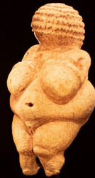
Figura 1. Venus de Willendorf (25,000 a.C.), en el Museo de Historia Natural de Viena.

Por su parte, a los márgenes de aquellas incipientes urbes otros hombres y mujeres vivían al amparo de regiones no asimiladas al cultivo: parajes donde las semillas no germinaban —ni, con ello, el tiempo—, donde las bestias vivían al amparo de espíritus —sin amos— y donde era aún desconocida —y acaso imaginable— aquella vaga noción de «hogar». 3