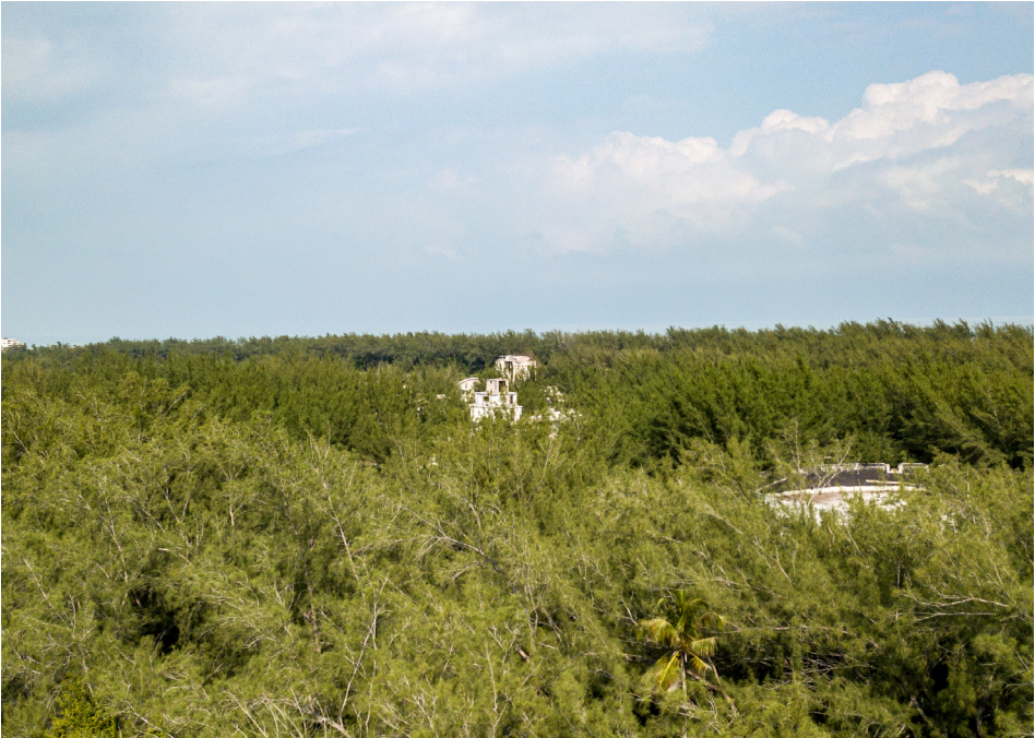
Figura 7. Ruinas circulares en Ciudad Madero, Tamaulipas, frente al Golfo de México.

Karl Schmitt definirá como el Nomos — bajo el cual, en un espacio de tiempo lineal, el principio de legalidad expansiva que constituye el ethos urbano occidental busca asimilar toda criatura y espacio sobre su ordenamiento fundamentado en la autorrealización de su naturaleza como el sentido último de lo humano. En contraste, todo aquello que se le opone —la naturaleza, el ethos nomádico, la voluntad de las ánimas— encarna la Anomia, es decir, las fuerzas demoniacas y el advenimiento del Apocalipsis.