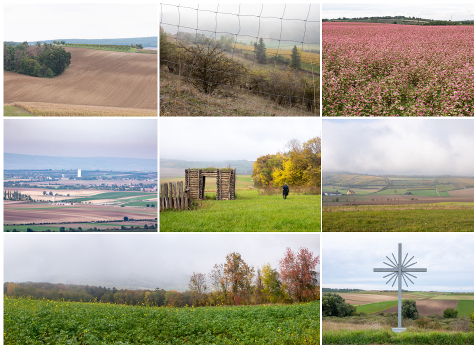
Figura 2. Campos de cultivo en el Weinviertel de Europa Central, sitio de origen de la cultura LBK.

Hacia el Mesolítico, los labradores y sus granos inusuales llegaron a un paraje insólito. En las tierras altas de Moravia, la precipitación era moderada —lo que permitía almacenar las cosechas—, los inviernos fríos y los veranos cálidos; y el caudal del Danubio, constante. Aquel suelo oscuro y resiliente 4 permitiría a los agricultores perpetuarse por más generaciones que sus antepasados. Y la tierra les fue propicia. Los muertos sembrados en las postrimerías de sus cultivos se fueron acumulando, lo que brindó a su progenie la fuerza de su espíritu.