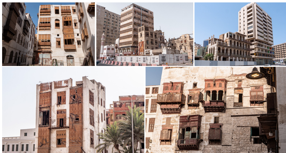
Figura 5. Barrio Histórico de Al Balad, en Yida, Arabia Saudita.

Desde su unificación y conformación moderna, el Reino Saudí ha aprovechado los excedentes petroleros para acometer sucesivos proyectos de expansión y remodelación de sus urbes. En la ciudad y puerto de Yida, frente al Mar Rojo, esta tendencia es visible en las sucesivas capas de estilos arquitectónicos distintos que, como si fueran parte de un mosaico lóbrego, laten agónicos.