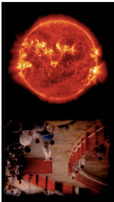
Figura 19. Julia Zurilla: Bravo Horizonte (de la serie Horizontes Verticales ) (2017). Duración 3 min, 18 seg. Formato HD. Proyección vertical en monitor.

En la obra Sistema Solar Después de los Humanos (2022-2023) o en Estudio de la Superficie Lunar Después de los Humanos (2020-2022) (figura 17), el artista Rodrigo Urbina plantea una serie de paisajes antropogénicos: esferas materiales sumidas en su ruina natural. Utilizando como moldes de vaciado balones de voleibol dañados (figura 18), la obra se vale de las metáforas posibles para relacionar un deporte humano con la destrucción planetaria; no obstante, en estas piezas la ruina no habla de un pasado preciso, sino del desierto como una inminente posibilidad sin tiempo. Así, al observar las imágenes que llegan del espacio exterior, una pregunta se hace inevitable: ¿son los otros planetas del Sistema Solar desiertos esféricos? Entendiendo el desierto como una figura fundacional del paisaje, ¿han llegado a la última ruina de sus días estos planetas, o se encuentran aún en un estado matricial? O finalmente, siendo el oasis la irrupción del paraíso en medio del desierto, ¿es la Tierra un oasis en el espacio? En su sostenida intención de resignificar la ruina, el trabajo de Urbina recurre al uso de materiales desechados de las dinámicas urbanas, de los cuales extrae las potencialidades discursivas al ensamblar, asociar e intervenir dichos objetos, para así entender el arte como una forma de habitar un paisaje irreversiblemente trastocado por el ser humano.