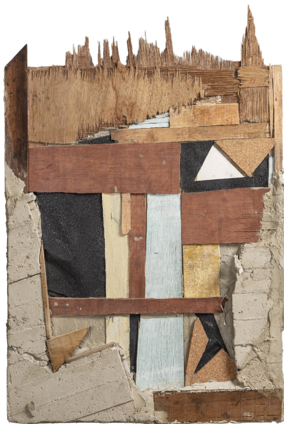
Figura 14. Federico Ovalles: Sustrato #8 (2022). Cemento, madera y escombros de construcción encontrados y ensamblados sobre madera. 80 x 60 cm.

Generalmente, descartados de toda función, los residuos se convierten en desechos que perecen ante la imposibilidad de cumplir con el objetivo que propició su origen (aunque no dejen de existir en su condición tangible). Empero, los residuos hallados por Ovalles y tomados del descarte de la vida urbana encuentran nuevas finalidades al ser aglomerados y unificados en los formatos trabajados por el artista; de allí que, una vez convertidos en soporte físico, los Sustratos (figura 14) de Ovalles abandonan toda lectura ruïnista para brindar posibilidades poéticas del origen del paisaje como superficie de germinación de nuevas formas de existencia en su propia heterogeneidad material.