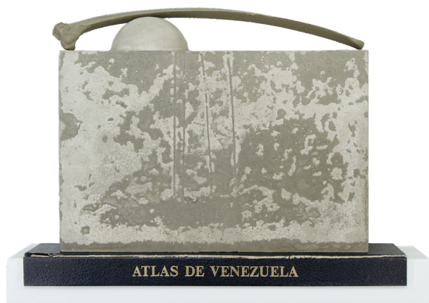
Figura 6. Eduardo Vargas Rico: Atlas de Venezuela (Naturaleza Muerta) (2022). Escultura.