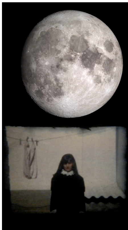
Figura 20. Julia Zurilla: Horizonte Menguante (de la serie Horizontes Verticales ) (2022). Duración 3 min. Video collage. Formato HD. Proyección vertical en monitor.