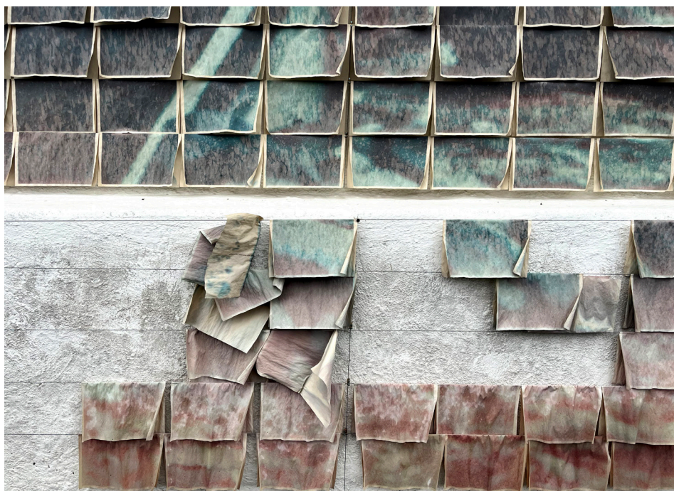
Figuras 7 y 8: Teresa Mulet, Libro-Mural: Archivo-Ruina: La Casa en la Intemperie [detalle] (2022). Inyección de tinta sobre papel. Medidas variables.