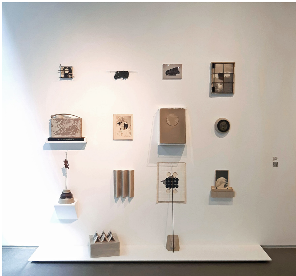
Figura 5. Eduardo Vargas Rico: Construcción Arqueológica Para la Introducción Cartográfica al Atlas de Venezuela (2022). Instalación. Medidas variables.