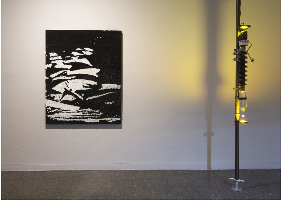
Figuras 1 y 2. Ana Alenso: El Resplandor Los Dejó Ciegos (2022). Instalación. Piedras de asfalto, botellas de agua, pistola dispensadora de combustible, mangueras, luces LED, lentejuelas y objetos encontrados. Medidas variables.