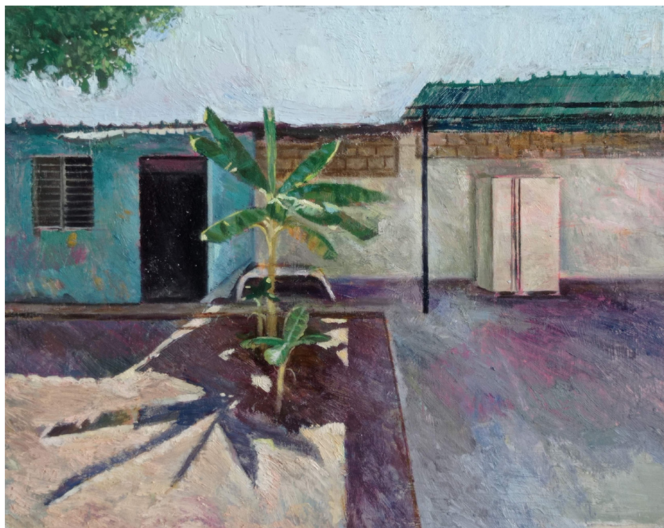
Figura 9. Jurgens Portillo: Patio 3 (2022). Óleo sobre madera. 24 x 30 cm.

ahora obstaculizada por precarios elementos de encierro, que encuentran en trabajos como Oxidize (2023) un detalle de su propio deterioro, planteando una contradicción constitutiva de la contemplación de las ruinas: el deseo de acceder a un tiempo pasado imposibilitado por las limitaciones de la naturaleza.