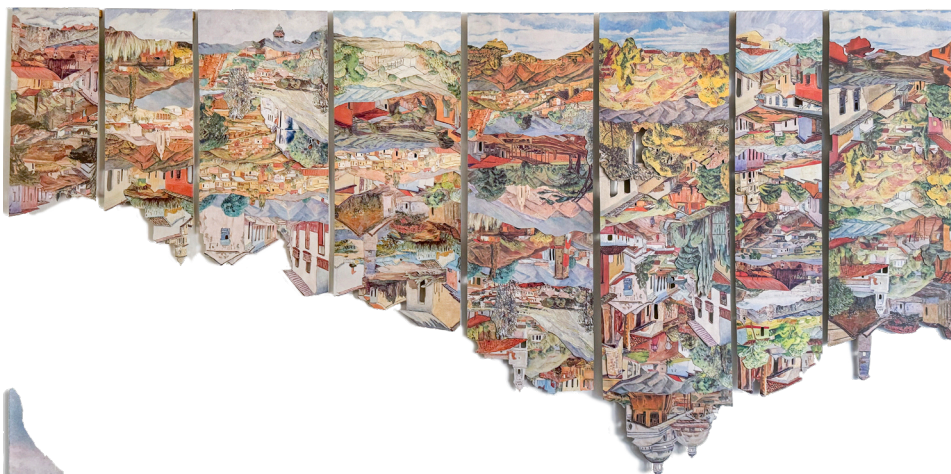
Figura 3. Manuel Eduardo González: Rafael Monasterios 1984 (De la serie Sedimentaciones ) (2018). Papel impreso, cortado y ensamblado. 75 x 150 cm (8 partes). Cortesía del artista.