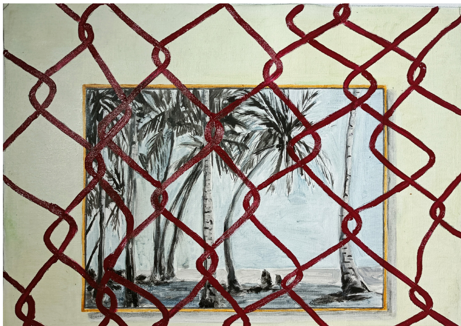
Figura 10. Luis Mata: Litoral (2023). Óleo sobre lino. 30 x 40 cm. Cortesía del artista.

En la obra de Génesis Alayón, la noción de paisaje surge desde un profundo vínculo con los recorridos afectivos de la artista: a través del andar como práctica estética, Alayón captura imágenes que, tras ser traducidas al lienzo por medio de un minucioso proceso pictórico, evidencian el triunfo del tiempo sobre las construcciones humanas. Haciendo énfasis en detalles que se adentran en el paisaje habitado e intervenido por el ser humano para dar lugar a la vida, las pinturas de Alayón muestran un paisaje que transita por su propia pérdida, una pérdida materializada en el desgaste de las ventanas, la erosión de las paredes y el desvencijado de los objetos que permite entrever las dinámicas de las personas que desarrollan su existencia entre estos elementos arquitectónicos.