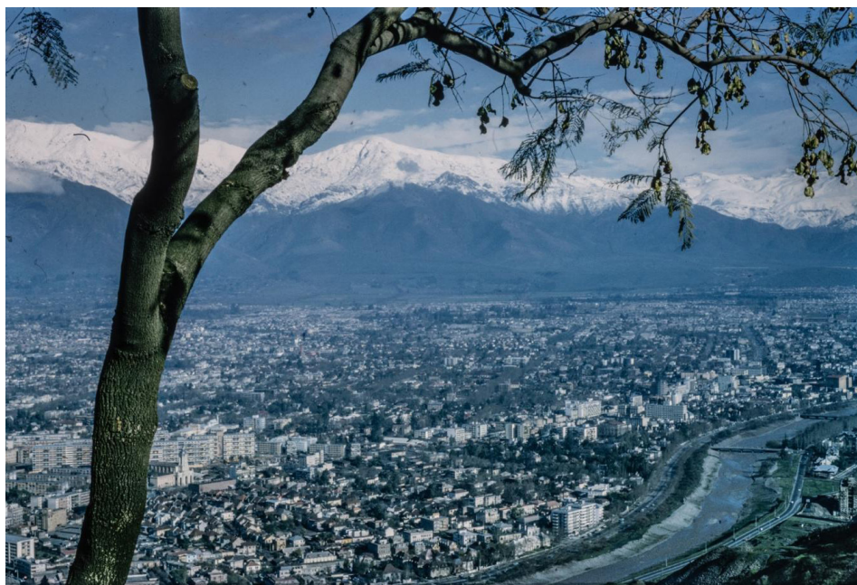
Figura 7. Fotografía de Santiago, vista desde el cerro San Cristóbal. Archivo Sernatur, Biblioteca Nacional de Santiago. Autor y fecha desconocidos.

En el archivo fotográfico de la Biblioteca Nacional se encuentra actualmente un conjunto de cajas de diapositivas recientemente donadas, sin organizar. Estas imágenes carecen de clasificación y de un sistema de indexación definido. Están almacenadas principalmente en cajas de conservación selladas, lo que implica que para visualizarlas se requiere una mesa de luz y una revisión minuciosa, imagen por imagen.