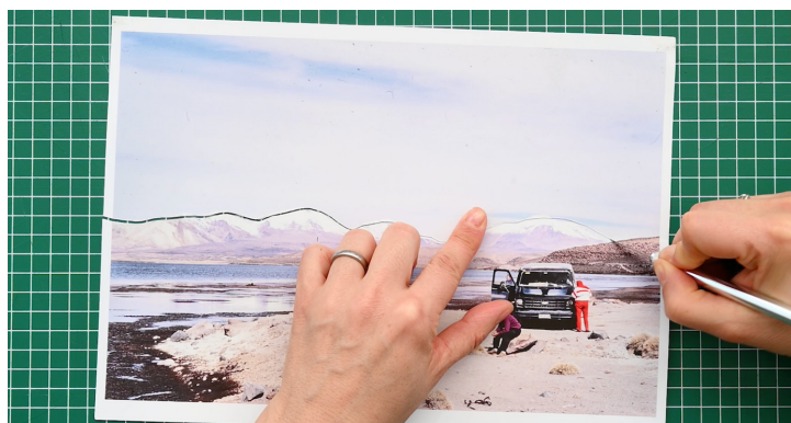
Figura 14. Still video. Fracturas expuestas .