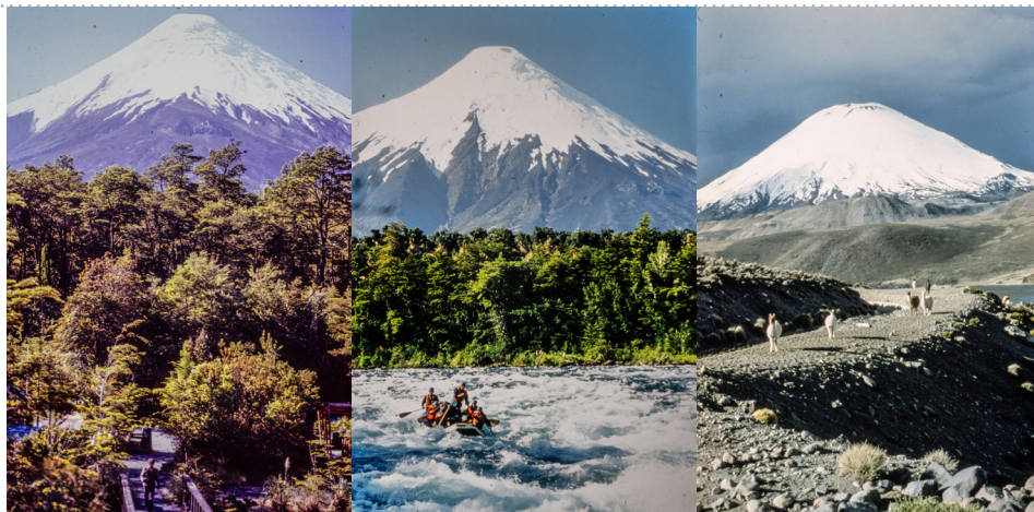
Figura 8. Fotografías de distintas vistas de volcanes en Chile.

La primera corresponde a la creación de un stand de Chile para la feria FISA (Feria Internacional de Santiago), 6 donde se construye una montaña-triángulo. Se fotografía el proceso de construcción de maquetas a escala del proyecto de imagen-país. En ese stand, se construye la montaña-triángulo y en las imágenes que aparecen en el archivo (sin fecha) aparecen dos formas de montañas, ambas triangulares. En un caso, la montaña triangular se convierte también en montaña-muralla (figura 9), mientras que en el segundo (figura 10) es una montaña-triángulo-isla. Ambas muestran la relevancia de la montaña en el imaginario nacional, poniendo énfasis en la relación entre cordillera e identidad que hemos desarrollado y, al mismo tiempo, develando una suerte de dialéctica entre la manualidad de la imagen manufacturada (creada por las manos que construyeron las maquetas) y la imagen técnica que aparece al convertir la maqueta en fotografía.