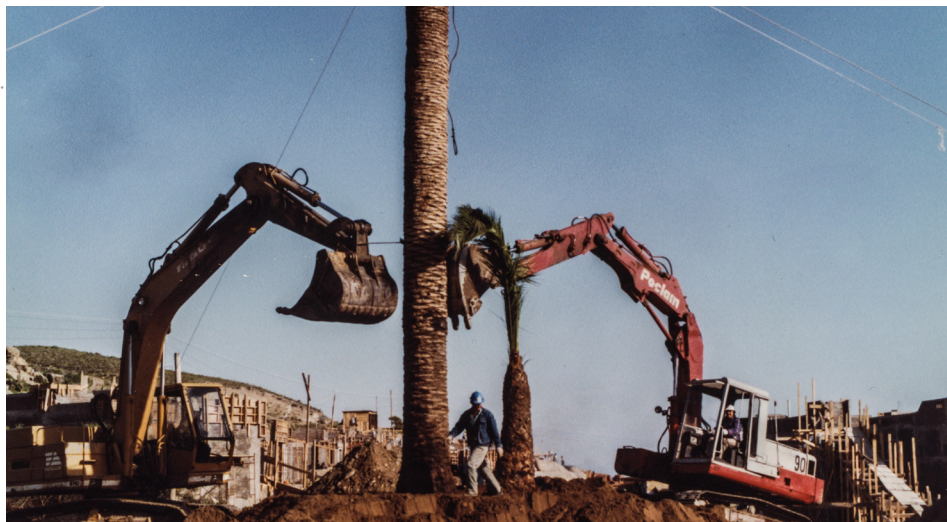
Figura 12. Fotografía de construcción del centro turístico Las Tacas, IV región, Chile. Fecha desconocida.

Junto a las imágenes de mi padre me preguntaba: ¿es posible crear una tabla que muestre la pérdida de biodiversidad por año y por metro cuadrado? Puedo utilizar su planímetro para medir esas áreas irregulares, ¿cuántos metros menos tiene de espesor nuestra cordillera? ¿Será que al medir logro ver la montaña?