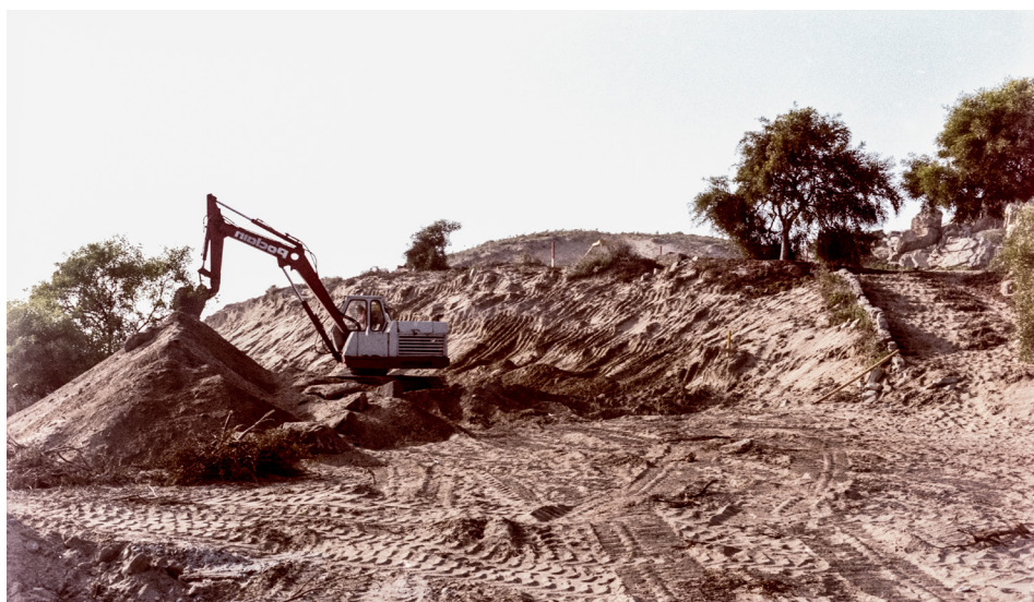
Figura 11. Fotografía de construcción del centro turístico Las Tacas, IV región, Chile. Fecha desconocida.

Comencé este proyecto hace varios años (no sé si puedo decir que lo comencé o si me ha acompañado desde siempre y ahora logro hacerlo imagen y palabra). Con la muerte de mi padre, me tocó dismantelar su vida, ordenar sus archivos y varias maletas de imágenes que registraban sus procesos y que no fueron a parar a los álbumes oficiales. Él, ingeniero, como muchos hombres de su generación impregnados del espíritu moderno y las promesas del progreso, veía a la naturaleza (nuevamente LA) como un objeto al servicio del humano, un territorio para dominar. En las imágenes retrata la industria, las modificaciones al paisaje con retroexcavadora. Sus imágenes son técnicas, muestran materiales, avances, formas. No buscan la grandilocuencia de una obra proyectada, sino que son un cuaderno de notas sobre sus procesos.