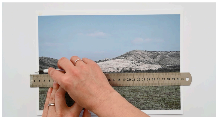
Figura 6. Still video Fracturas expuestas .

Es posible establecer que la cordillera y su representación narran las diversas interacciones que hemos tenido con la naturaleza, y cómo esta categorización (entre natural y cultural) se establece fundamentalmente con el advenimiento de la nación. Según Arenas, Núñez y Sánchez (2013), debido a un cambio importante en el panorama, esta majestuosa cordillera experimenta una transformación que la convierte en un componente crucial para la configuración de una territorialidad con alcance fronterizo, intrínsecamente vinculada a las necesidades de la institucionalización espacial impulsada por el poder estatal (p. 97).