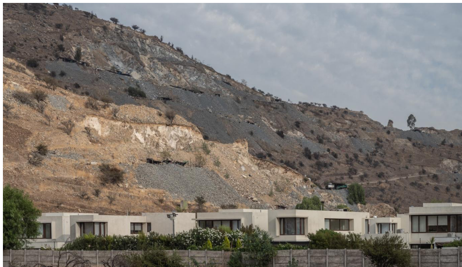
Figura 13. Fracturas Expuestas .

Así que decidí intentar repararla, explorando quizás con otras herramientas. Al observar y retratar, me di cuenta de que la crisis climática social ya no se describe en el código de futuro, sino que la habitamos sin mirarla. Busqué una imagen que me permitiera repensar las posibilidades existentes para crear una contramirada que describa ese co-sentir con la cordillera. Sin dejar de lado cómo la fotografía, incluso en mi propia práctica, tenía una vinculación directa con esos cambios en los territorios; pareciera que esa estética de la catástrofe al mirar los territorios solo profundizaba las grietas o heridas que se perciben en mis montañas.