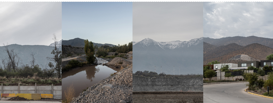
Figura 3. Composición de imágenes de la cordillera de los Andes en la zona central de Chile. © María/Rosario Montero, 2023.

los territorios americanos, Walter Mignolo (2007), entre otros, nos invita a cuestionar estas categorizaciones desde el pensamiento eurocéntrico, surgiendo en el proceso una revalorización de los conocimientos ancestrales, como la noción de Pachamama concebida por los pueblos Quechua y Aymara. Para ellos, Pachamama representa la relación humana con la vida y se traduce hoy como «madre tierra», sin distinguir entre naturaleza y cultura. A pesar de los esfuerzos coloniales por suprimirla, esta perspectiva está arraigada en muchas tradiciones y prácticas de los pueblos de los Andes. Esta reflexión es relevante ya que plantea la posibilidad de comprender que no toda representación de la cordillera ha sido siempre esa cordillera distanciada, sino que ha tenido otras figuraciones que la presentan como un territorio cohabitado.