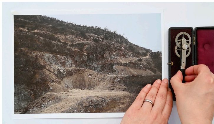
Figura 5. Still video Fracturas Expuestas . © María/Rosario Montero, 2023.

Esto nos lleva a reflexionar sobre el poder transformador que poseen las corrientes de pensamiento ecofeministas. 3 La conexión entre colonialidad y patriarcado, tal como lo plantean Vandana Shiva y María Mies, nos ayuda a comprender los problemas de clasificación entre lo natural y lo cultural, desde la perspectiva de los feminismos relacionales, enfocándonos en el patrón de poder moderno que busca la dominación tanto sobre los cuerpos femeninos como sobre la naturaleza. A nivel ontológico, el ecofeminismo critica la concepción de la «economía del mismo», que considera al hombre como sujeto y a la mujer como el otro, perpetuando una visión colonial moderna que invisibiliza la dimensión sociopolítico-cultural en las investigaciones sobre el Antropoceno. La cordillera feminizada nos permite observar estas relaciones entre mujer/naturaleza, ya que en las formas que toma su explotación/capitalización, principalmente en la industria minera y la expansión urbana, se hace visible como heridas en el territorio.