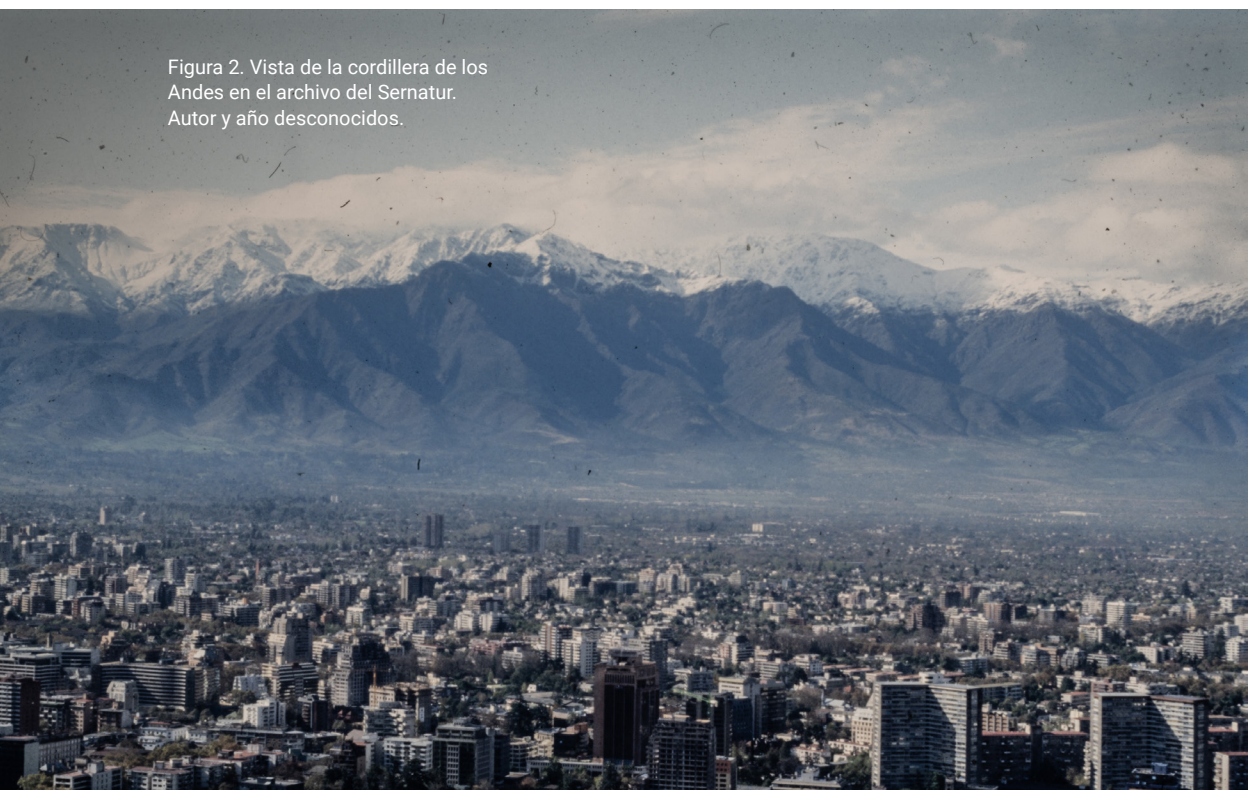
Figura 2. Vista de la cordillera de los Andes en el archivo del Sernatur. Autor y año desconocidos.

Vivo en Santiago, la capital de Chile, a los pies de la cordillera de los Andes. En mi antebrazo, entre la mano y el codo, llevo dibujada la silueta de la cordillera desde el año en que nació mi hijo, tal como se aprecia desde el cerro San Cristóbal. Es una línea que marca mi territorio y expresa la añoranza por la presencia de esa montaña en mi vida. Siempre he sentido que mi cuerpo alberga una suerte de compás que me orienta en los puntos cardinales. Creía que esta brújula interna era una cualidad inherente hasta que viví lejos de la cordillera. Recuerdo la primera vez que salí de una estación de metro sintiendo que la ciudad estaba creada por burbujas-estaciones en vez de territorios continuos. Me percaté de que no tenía un horizonte al cual acudir para corregir mi andar y situar mis pensamientos. Comprendí entonces que mi sentido de orientación nunca había sido mío; era un cosentido, una forma de sentir con la cordillera.