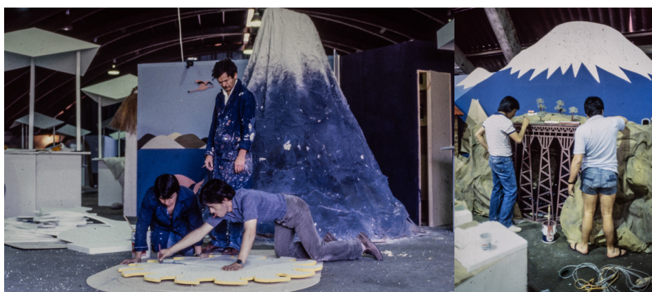
Figuras 9 y 10. Fotografía de la construcción del stand de Chile para la FISA.

La primera corresponde a la creación de un stand de Chile para la feria FISA (Feria Internacional de Santiago), 6 donde se construye una montaña-triángulo. Se fotografía el proceso de construcción de maquetas a escala del proyecto de imagen-país. En ese stand, se construye la montaña-triángulo y en las imágenes que aparecen en el archivo (sin fecha) aparecen dos formas de montañas, ambas triangulares. En un caso, la montaña triangular se convierte también en montaña-muralla (figura 9), mientras que en el segundo (figura 10) es una montaña-triángulo-isla. Ambas muestran la relevancia de la montaña en el imaginario nacional, poniendo énfasis en la relación entre cordillera e identidad que hemos desarrollado y, al mismo tiempo, develando una suerte de dialéctica entre la manualidad de la imagen manufacturada (creada por las manos que construyeron las maquetas) y la imagen técnica que aparece al convertir la maqueta en fotografía.