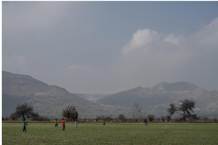
Figura 15. Fracturas Expuestas. © María/Rosario Montero, 2013.

Este escrito busca mezclar miradas y voces para dar cuenta de una investigación corporizada, un sentipensar (Escobar, 2014, p. 14) con la cordillera. A través de la imagen afectada, se intenta comprender una posibilidad otra que nos permita transitar en este presente que ya es crítico y que necesita futuro. A las reflexiones del archivo del Sernatur se suma una mirada crítica sobre mi biografía, explorando cómo la mirada masculina durante los periodos de dictadura y posdictadura refuerza un régimen escópico en el cual el paisaje y los territorios (y su imagen) están al servicio del capital.