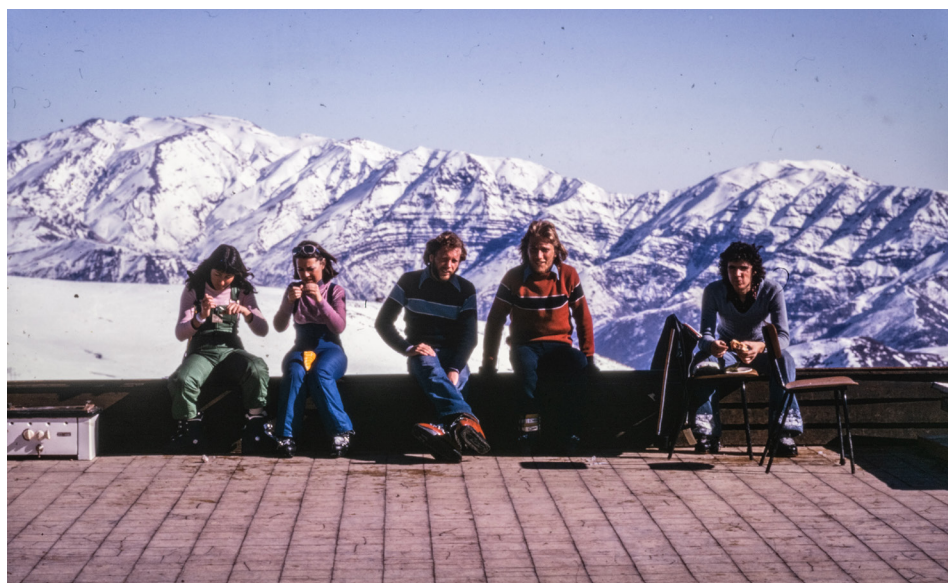
Figura 4. Vista de la cordillera de los Andes desde un centro de esquí cercano a la ciudad de Santiago