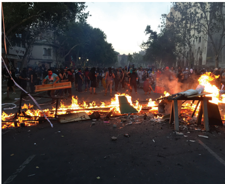
Barricadas en construcción y en uso. En la fotografía 10, los manifestantes levantan una barricada de manera cooperativa para proteger de la policía a los manifestantes agrupados en la Plaza de la Dignidad. En la fotografía de la derecha vemos otra barricada, encendida.