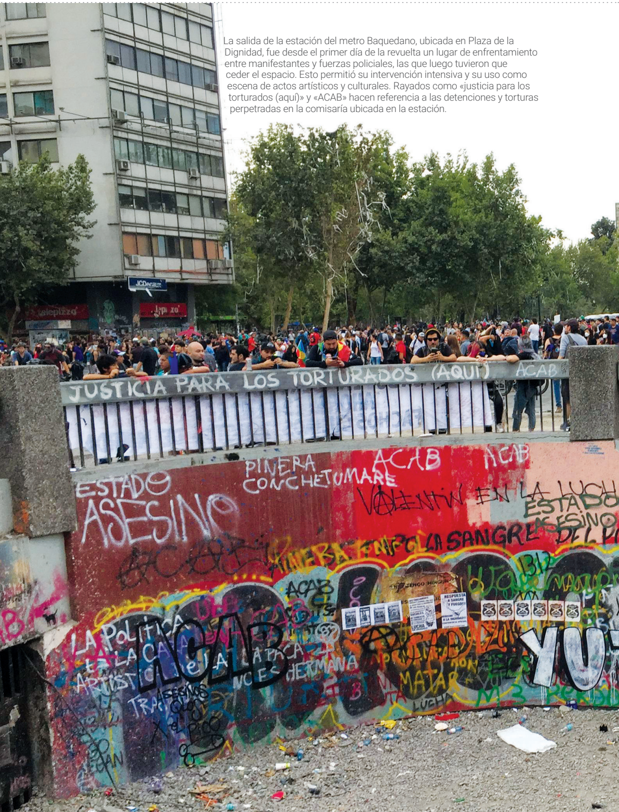
La salida de la estación del metro Baquedano, ubicada en Plaza de la Dignidad, fue desde el primer día de la revuelta un lugar de enfrentamiento entre manifestantes y fuerzas policiales, las que luego tuvieron que ceder el espacio. Esto permitió su intervención intensiva y su uso como escena de actos artísticos y culturales. Rayados como «justicia para los torturados (aquí)» y «ACAB» hacen referencia a las detenciones y torturas perpetradas en la comisaría ubicada en la estación.