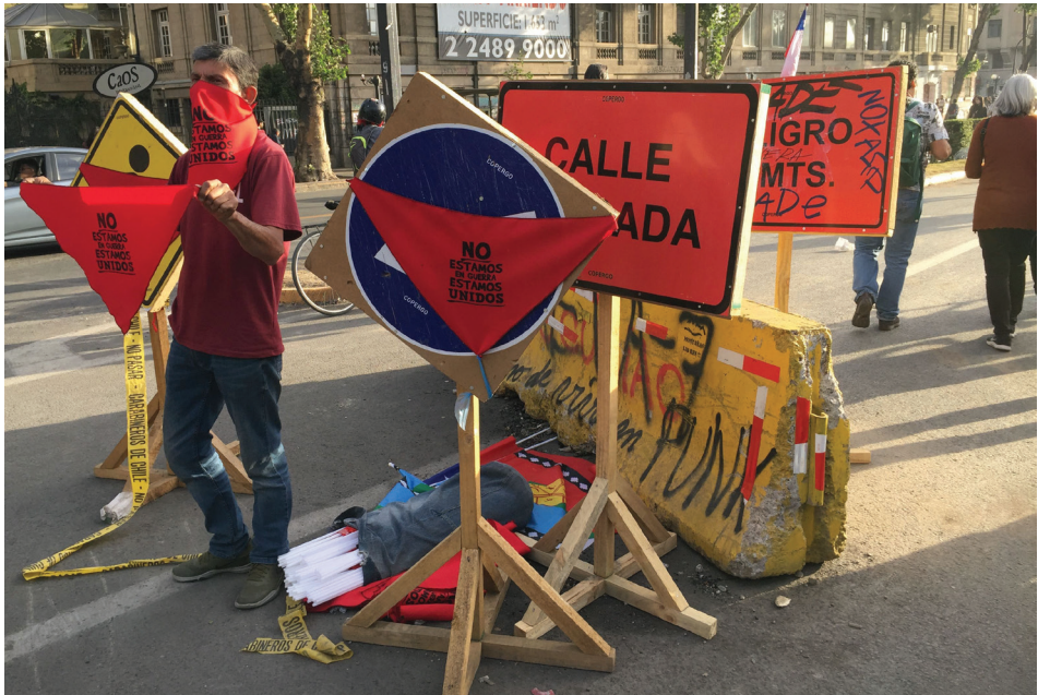
Un vendedor ambulante presentando sus productos para manifestarse, como pañuelos, banderas y carteles, instalado sobre una barricada levantada por manifestantes con objetos sacados de un arreglo vial.