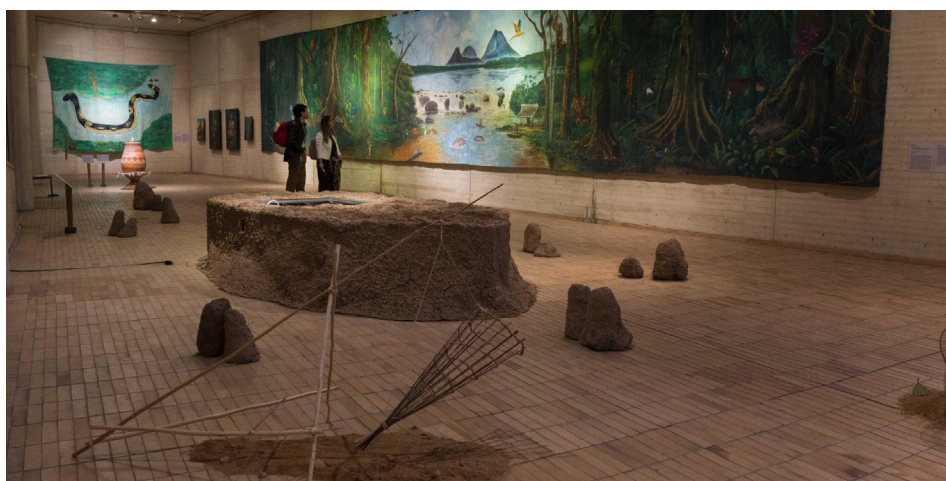
Figura 1. Vista general de la exposición De selvas, mitos y canoas: un viaje por el arte de la tierra , en el 46° Salón Nacional de Artistas (Centro Cultural Gabriel García Márquez, Bogotá, 2022).

Lo anterior tiene como objetivo poner de manifiesto cómo en la historia del arte y en la historia política de Colombia se ha censurado lo alternativo, lo popular y «el pueblo» desde el mundo de las artes. El 46° Salón Nacional de Artistas es una manifestación reciente del hilo narrativo de segregación y censura hacia las formas de arte alternativas en Colombia. Esto contrasta con la función curatorial, que se propone como un proceso que trasciende la mera exposición de arte, convirtiéndose en un potencial vehículo para un tránsito onto-estético-político hacia el habitar-se la tierra.