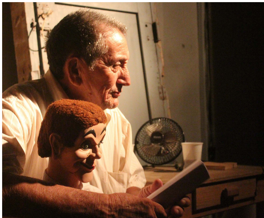
Recado negro, 2017.