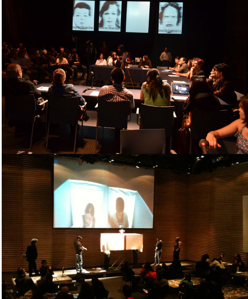
Atlas electores 2012, 2012.

escuché con la voz enojada, me dijo: “Es que te dije que era pobre y era huérfana”, entonces yo solo me quedé callada porque había cosas que no lográbamos entender porque es otra persona, está en otro lugar y creo que ahí había algo muy importante, había una manera de representar las distancias que me parece que Deus... lograba intuir: representar el espacio entre dos personas.