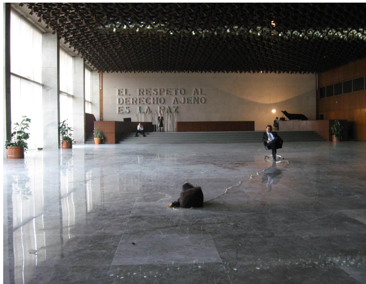
S.R.E. Visitas guiadas , 2007. Cortesía Teatro Ojo.

en poder reunir, como un gesto de aglutinamiento efímero de presencias y, sobre todo, de voces que se encuentran en un mismo lugar y en un tiempo más o menos acotado. Entonces, creo que esa forma de lo común pasa por ese momento efímero.