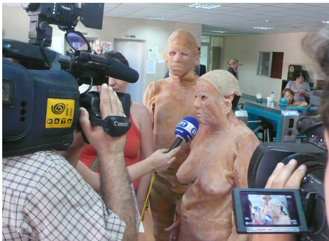
Ponte en mi pellejo , 2013.

HB: Bueno, y sobre lo que decía Pato con una metáfora, lo de danzar ante el huracán o ante el temblor: danzar con el temblor para no caerte. Eso tiene que ver con la desorganización que está ocurriendo y con una forma de ir acompañando esta desestructuración de certezas que al menos yo tenía de niño. Por ejemplo, el zapatismo. El neozapatismo irrumpe en el 94 en Chiapas, en México. Y aquí hablo personalmente porque es un fenómeno que si bien pasa a muchos kilómetros de distancia y a muchos siglos de distancia de mi propia realidad, también nos es contemporáneo y de alguna manera sí