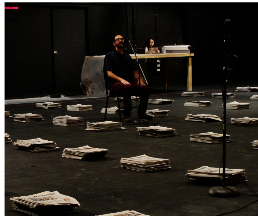
Lo que viene , 2012.

HB: Hay una figura importante que tensiona el trabajo de Teatro Ojo y es algo que tiene que ver con un proyecto que no sé si lo terminaremos, o si se está terminando con otros nombres. Tiene que ver con una cruz parlante en Yucatán, una cruz que en el siglo XIX incitó a los mayas a rebelarse contra el Estado mexicano. Y habló, se dice, a través de un acto de ventriloquia, habló porque en el mundo maya todo habla. Pero el caso es que dejó de hablar en principio porque el ejército entró a la zona rebelde en la selva maya y le cortó la lengua al ventrílocuo que hablaba, llamado Manuel Nahuat. Sin embargo, luego la cruz se siguió comunicando por cartas escritas o a través de unos sonidos incomprensibles que un intérprete traducía después por cartas. Luego ha estado en silencio por mucho tiempo y esa latencia de esa cruz que no ha hablado pero que, en una puesta en escena de larguísima duración (que ha-