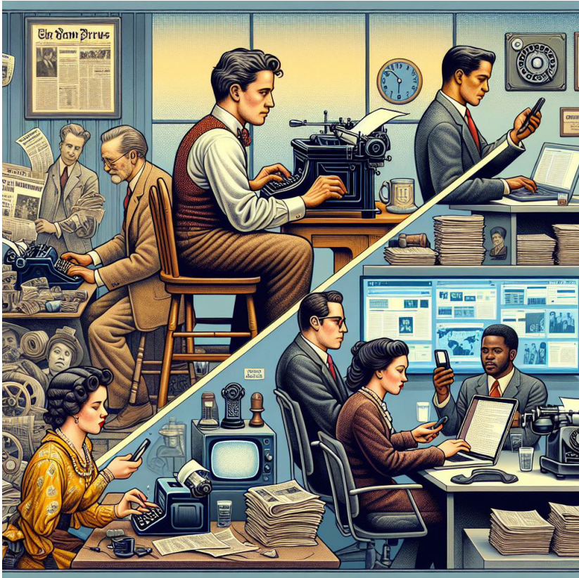
Imagen 1. La revolución tecnológica cambió las dinámicas de producción de noticias del papel a la pantalla. Imagen generada con inteligencia artificial.

En tiempos de la analogía sucedía algo similar, con un origen diferente, las noticias estaban necesariamente intervenidas por los periodistas y los medios. Otra vez, trozos de información que se armaban bajo las reglas de la ética, la técnica y la estética de la mediación de los hechos del mundo.