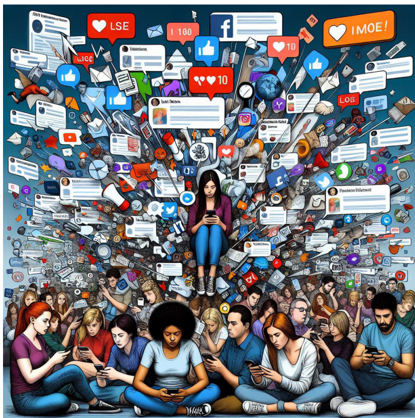
Imagen 3: La revolución tecnológica ha provocado que vivamos la era de la 'infoxación' por la saturación de contenidos en internet. Imagen generada con inteligencia artificial.

Ahora, soy un emigrante del teletipo que, como inmigrante de la inteligencia artificial, intenta bajar la angustia y despejar el ambiente con observación, estudio y reflexión.