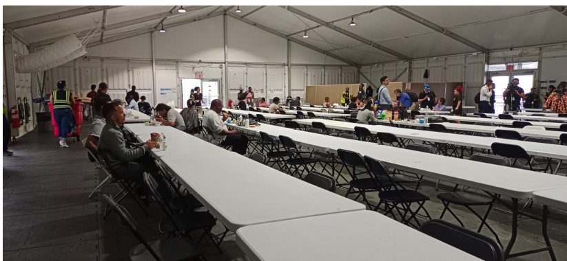
Imagen 5. Un comedor para migrantes irregulares en uno de los refugios de Nueva York. El término migrante queda restringido a un grupo reducido de personas que son entendidas en cuanto a movilidad humana, como ilegales.

Aunque la OIM designa al migrante como “toda persona que se traslada fuera de su lugar de residencia habitual, ya sea dentro de un país o a través de una frontera internacional, de manera temporal o permanente, y por diversas razones” (2019), diferenciando entre migrantes regulares, irregulares, en situación vulnerable o trabajadores migrantes, la realidad es que en un mundo globalizado como en el que vivimos actualmente, la migración es un fenómeno cada vez más natural. Hoy más que nunca, es fácil encontrar miles de personas que se desplazan de su lugar de origen y que se instalan alrededor del mundo por diferentes razones y en una buena parte de los casos no tiene que ver con un riesgo inminente. Aunque muchas de las razones para esas movi­lidades no forzadas tienen que ver con el estudio, el placer, mejores opciones de trabajo, viajes, nomadismo digital, etc., la categoría de migrante sigue siendo reservada para un grupo de personas específicas, es decir, para aquellos que transitan fronteras de manera irregular y que no tienen una autorización que reglamente su estancia.