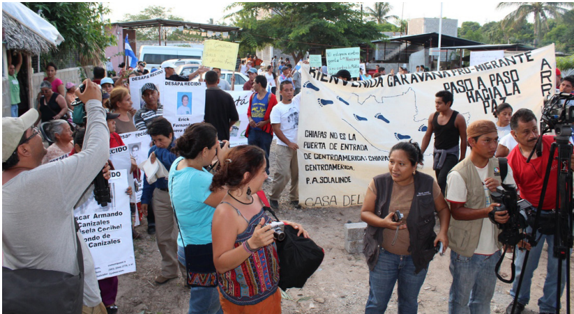
Imagen 2. El sueño americano es una ilusión para muchos latinoamericanos. Sin embargo, en el camino corren riesgo de muerte. Aquí una manifestación de migrantes que piden la paz.

Para ello, siguieron siendo fundamentales los elementos discursivos e ideológicos como el de asumirse como los salvadores del mundo ante la amenaza comunista, al menos hasta antes de la caída del Muro de Berlín, así como los que aludían a que, por haber trazado una virtuosa ruta de progreso, podían conducir al resto del mundo por la misma senda. Se colocó en el imaginario mundial una versión reeditada del “sueño americano”, incluso junto a una suerte de “sueño europeo-occidental” que, particularmente en el sur global, generó un efecto de llamada hacia las poblaciones que experimentaron las carencias derivadas del alargamiento de la crisis de los setenta que afectó a los países primario-exportadores, intensificando los flujos migratorios desde esos territorios hacia los denominados industrializados.