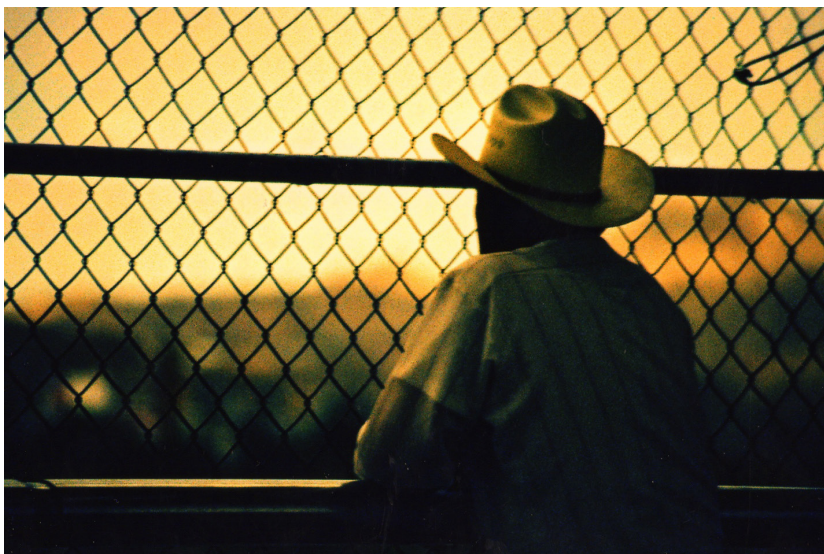
Imagen 1. Un símbolo de la división entre quienes persiguen el sueño americano y las barreras físicas y simbólicas que se consolidan con la llegada del neoliberalismo, que profundiza las desigualdades humanas.