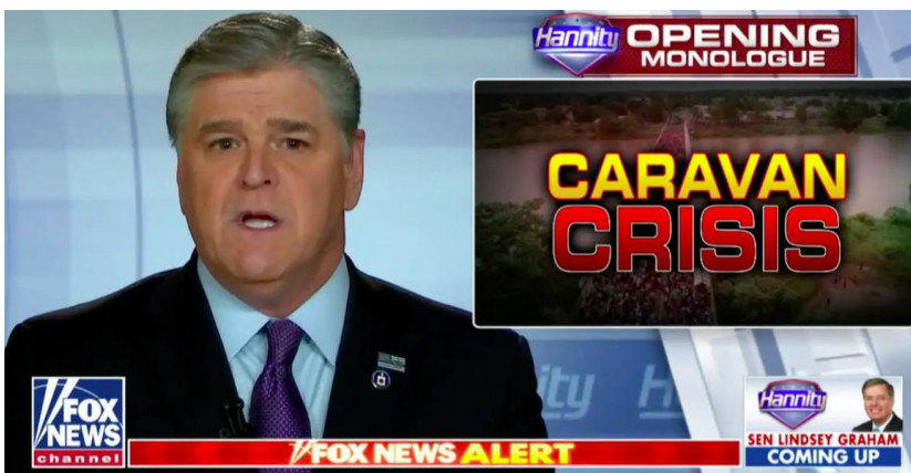
Imagen 6. Titular de una noticia sobre caravana de migrantes hacia Estados Unidos en Fox News.

Durante la crisis migratoria en Europa, fue claramente visible la difusión de discursos que asociaban a los refugiados con el terrorismo y la delincuencia, replicando opiniones políticas que encasillaron a grupos diferentes (sirios, afganos o africanos) en una sola categoría, calificándolos colectivamente como una amenaza para la seguridad sin considerar las condiciones sistémicas que ocasionaron sus desplazamientos (Amnistía Internacional, 2014). En Estados Unidos, la narrativa mediática sobre la “caravana de migrantes” centroamericanos del año 2018, se reprodujo ampliamente tanto por medios de comunicación, Fox News, por ejemplo, como por diferentes figuras políticas que describen ese fenómeno social como una “invasión” que traerá consigo una “crisis” inminente. Ello se acompañaba con un bombardeo de imágenes y titulares alarmistas, creando un ambiente de miedo, tensión y rechazo hacia familias que solo habían partido buscando acceder al asilo norteamericano.