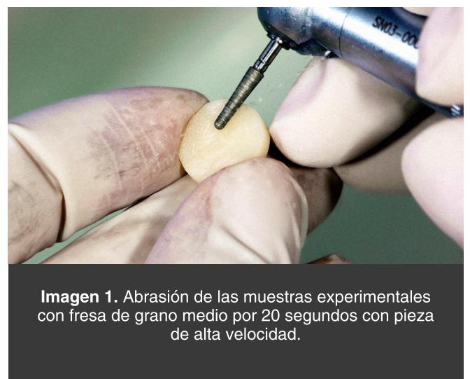
Imagen 1. Abrasión de las muestras experimentales con fresa de grano medio por 20 segundos con pieza de alta velocidad.

Se confeccionaron 70 especímenes de porcelana feldespática en forma de discos de aproximadamente 10 mm de diámetro por 5 mm de altura.