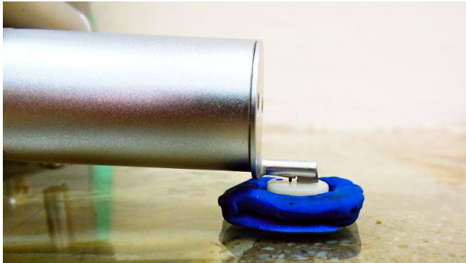
Imagen 2. Punta diamantada del perfilómetro realizando las mediciones en una muestra. La superficie de la muestra debe estar perpendicular a la punta.

Todas las muestras experimentales de los siguientes 9 grupos fueron sometidas a la abrasión con el fin de simular los ajustes de una restauración cerámica. El mismo operador realizó todos los procedimientos de abrasión y pulido para estandarizar la presión manual y