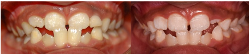
Figura 1. Fotografía intraoral de frente. a) Inicial. b) Control a los 15 días.

Los ejercicios empleados consistieron en: realizar sonidos semejantes a un sapo cuando croa, pronunciar palabras con los fonemas r, s, t, c, f con la boca cerrada, deslizar la lengua por el paladar de adelante hacia atrás con los dientes en oclusión y de la misma manera por las caras palatinas/ linguales de las unidades dentarias. Como indicación, estos ejercicios debían ser alternados y realizados durante todo el día con una duración mínima de 30 minutos en total. Para ello, se educa al padre y a la paciente acerca de la importancia de la constancia y buena ejecución de los mismos. Quince días después de la aceptación e instauración del tratamiento, se realiza el primer control en el cual se observa el descruzamiento de la mordida invertida. Finalmente, con el objetivo de mejorar la relación oclusal a nivel anterior, la terapia miofuncional continúa por 3 meses con disminución en la frecuencia de los ejercicios de forma secuencial hasta su suspensión. A los 6 meses de seguimiento y control, no se evidenció recidiva de la maloclusión inicial.