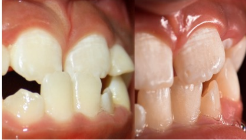
Figura 2. Fotografía intraoral de sobremordida. a) Inicial. b) Control a los 15 días.