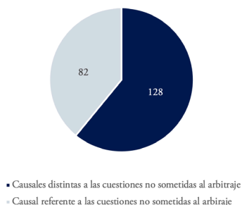
Figura 1. Acciones de nulidad propuestas entre 2017 y 2024 en función de la causal d) 23