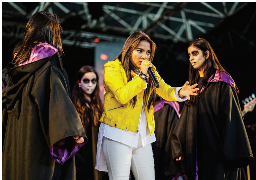
9 Maqueta o borrador de uno o más temas musicales.

Se sienten los nervios tras bastidores; es normal. Es la oportunidad de por primera vez enfrentarse a un público tan grande, en un espacio de estas características profesionales, con menos de 17 años. En realidad todos son ganadores. Es aquí donde se seleccionan a los que mañana tendrán ese primer demo 9 profesional que será la carta de presentación futura para sus nuevos proyectos. Aquí también se llevarán la posibilidad de montar por primera vez, o mejorar significativamente, sus cuartos de ensayos con instrumentos musicales y equipos de amplificación que les permitirán obtener el nivel musical que están buscando. Es aquí donde varios de ellos encontrarán el camino de entrar a una universidad y cumplir el sueño de ser músico profesional a través de una beca completa o parcial. El escenario cobra vida; la música, la diversidad y el talento hablan por sí solos.