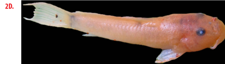
Figura 2. Patrón de coloración típicos y leucísticos: A). Ejemplar de Astroblepus fissidens con coloración normal (98 mm); B). Ejemplar de Astroblepus fissidens leucístico (70,23mm); C) Ejemplar de Astroblepus brachycephalus con coloración normal (94,34mm); D). Ejemplar de Astroblepus brachycephalus leucístico (40,75mm).

A pesar de la enorme diversidad de especies de peces presentes en Sudamérica, los reportes de aberraciones pigmentarias en la ictiofauna son muy escasos. Actualmente existen 20 casos reportados en 18 especies. Ocho casos se han reportado en Brasil, cuatro en Argentina, tres en Ecuador, un caso en Uruguay y tres casos no proporcionar referencias sobre la localidad, el 70% de estos casos corresponden albinismo y 30% a leucismo [Tabla 1]. En Ecuador son recientes los reportes de leucismo en vertebrados, atribuidos principalmente a la alta probabilidad de endogamia a causa del aislamiento poblacional [15, 30]. Además, recientemente se ha corroborado la reducción de pigmentación en astroblépidos que habitan galerías subterráneas [16].