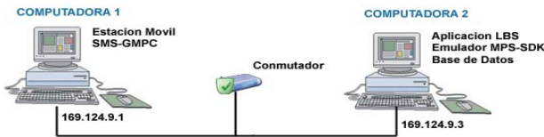
Figura 3. Arquitectura de la Aplicación LBS

En la computadora 1 se encuentra almacenado la aplicación que contiene la interfaz gráfica de la estación móvil y que realiza la función de puerta de enlace del servidor SMS. En el segundo ordenador se encuentran la aplicación del emulador, la aplicación LBS y la base de datos. El punto de mayor probabilidad de encontrar a la MS en el sector entregado por el emulador, es el centro geométrico del mismo. Luego de obtener las coordenadas del centro geométrico, la aplicación LBS realiza una consulta a la base de datos.