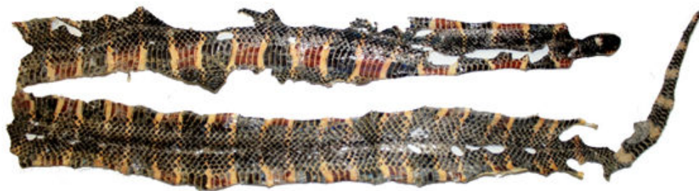
Figura 1: Piel de Micrurus steindachneri (MZUA.RE 0371, macho) colectada en el Área Ecológica de Conservación Municipal Tinajillas-Río Gualaceño, provincia de Morona Santiago, Ecuador.