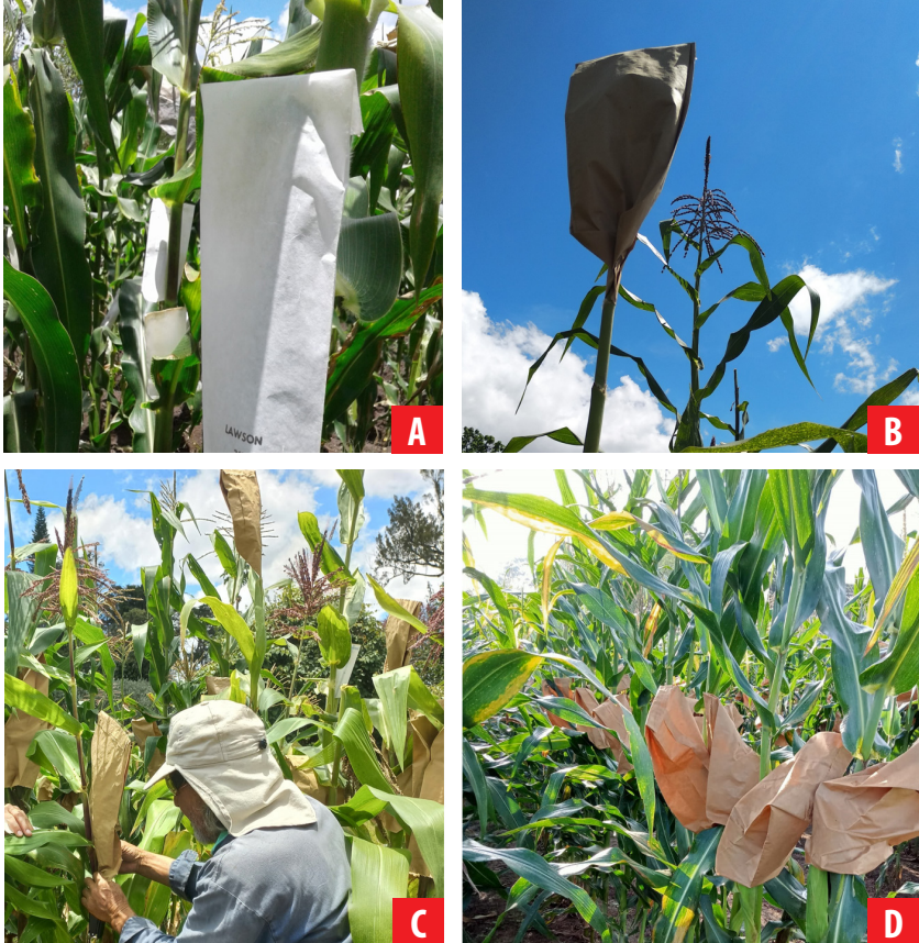
FIGURA 1. Polinización controlada de las accesiones de maíz a incrementar. A aislamiento de la inflorescencia femenina con bolsas tipo glassine , B recolección del polen con bolsas tipo kraft, C fecundación de los estigmas con el polen seleccionado, D inflorescencias femeninas polinizadas y aisladas.

La polinización fue controlada o asistida entre plantas al interior de cada una de las parcelas, para garantizar la pureza genética de las accesiones durante la multiplicación de la semilla. En la fase de prefloración, se eliminaron plantas fuera de tipo y se seleccionaron los individuos más vigorosos y de mejor desempeño para ser polinizados. El pedúnculo de la mazorca fue cubierto con una bolsa parafinada tipo glassine antes de la emergencia de los estigmas (Figura 1). Al inicio de la liberación de polen, se ejecutó la programación de polinización en campo: se cubrió la panoja y se recogió el polen con una bolsa de papel (tipo kraft). Al día siguiente, cada panoja donadora fue sacudida ligeramente para recoger el polen liberado y se retiró la bolsa cuidadosamente. En las plantas seleccionadas, las mazorcas con estigmas lo suficientemente expuestos —pero protegidos— fueron polinizadas al depositar directamente el polen colectado sobre los estigmas. Inmediatamente después se cubrieron con una bolsa de papel.