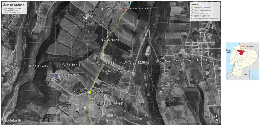
Ilustración 1. Localización del área de análisis (Comunidad Samael, Comunidad Cochasquí, Barrio San Francisco). Las tachuelas de colores son indicadores de las ubicaciones relevantes en el estudio. Se muestra el mapa del Ecuador de Google, resaltando la provincia de Pichincha y el Cantón Tocachi (flecha naranja).

Por último, y quizás lo más importante, el fracaso del saneamiento persiste porque la mayoría de los estudios evalúan la influencia de un factor individual en los resultados del saneamiento. Es necesario refundir los sistemas de saneamiento como sistemas complejos que interactúan con una vasta red de sistemas humanos, económicos, de infraestructura e institucionales igualmente complejos [5].