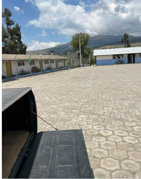
Figura 2. Barrio San Francisco