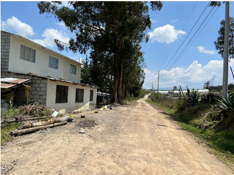
Figura 3. Calles de Cochasquí.