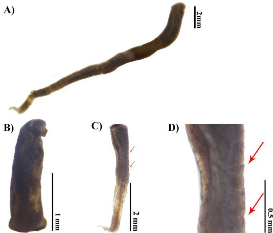
Figura 2: Ochoterenella sp. (MECN-SIN-001) encontrado adherido a la pared inferior del estómago de un Rhinella horribilis . A) Vista completa. B) Región cefálica. C) Región caudal. D) Detalle de bandas anulares del cuerpo.