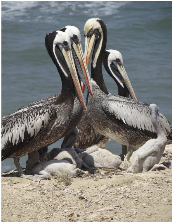
Figura 2: Pelecanus thagus anidando en el Refugio de Vida Silvestre Isla Santa Clara, provincia de El Oro, Ecuador. Arriba: Colonia en anidación. Abajo: Pichones desarrollados implumes.