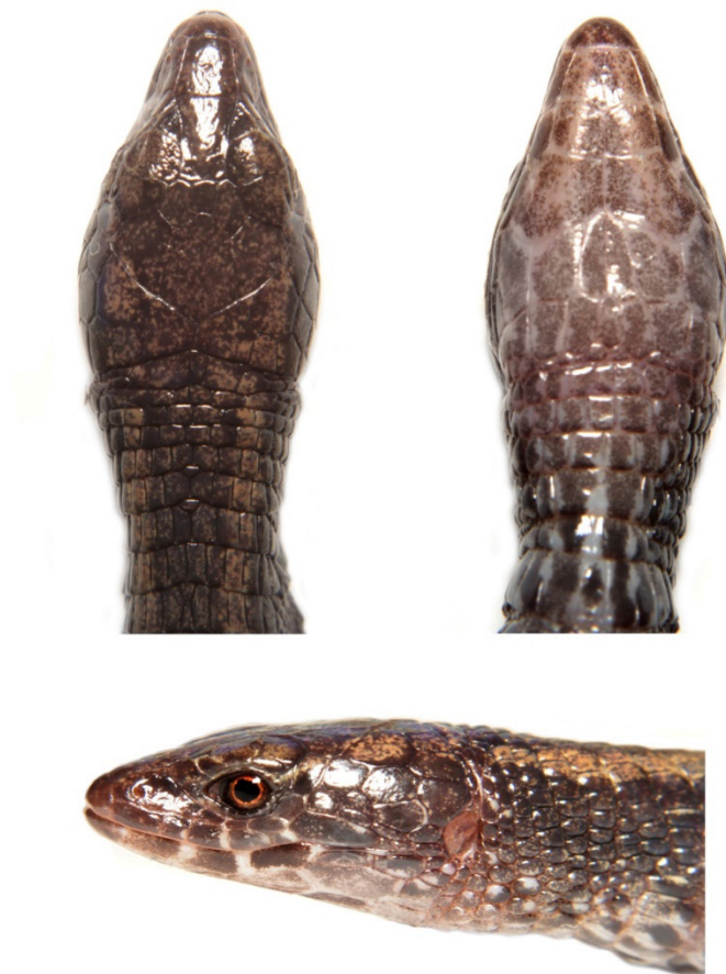
FIGURA 4. Detalle de la cabeza en vista dorsal, ventral y perfil del alotipo de Andinosaura kizirani (MZUA.RE.0287).